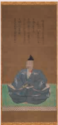
▲重要文化財 三好長慶像(聚光院蔵) [前期]