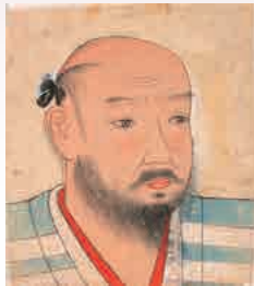
▲足利義輝像紙形(京都市立芸術大学芸術資料館蔵) [通期]