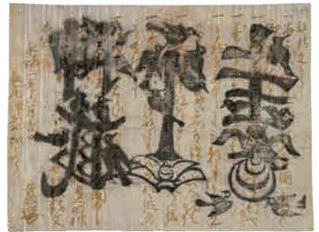
▲国宝「上杉家文書」近衛前久書起請文(当館蔵) [前期]