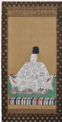
▲正親町天皇像(泉涌寺蔵) [通期]