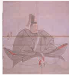
▲足利義昭画像(東京大学史料編纂所蔵模写) [後期]